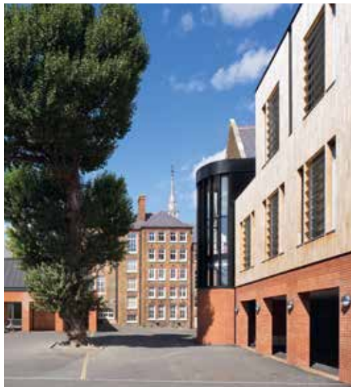
Dans la cour du CFBL